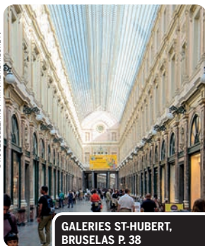
GALERIES ST-HUBERT, BRUSELAS P. 38