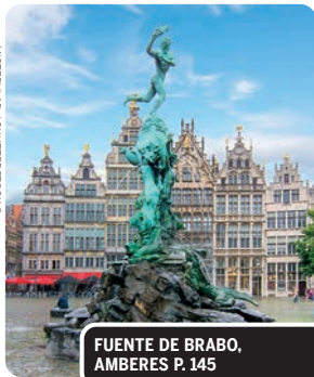
FUENTE DE BRABO, AMBERES P. 145