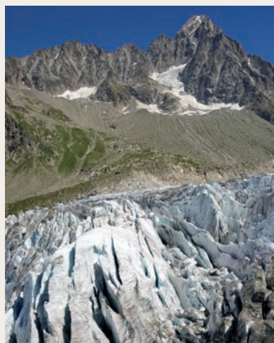
Glaciar de Argentière (p. 98).