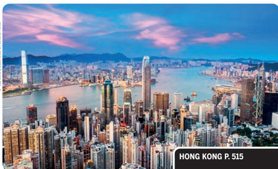
HONG KONG P. 515