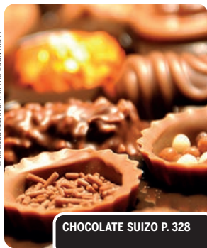
CHOCOLATE SUIZO P. 328