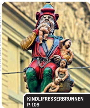
KINDLIFRESSERBRUNNEN P. 109