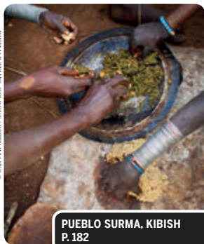
PUEBLO SURMA, KIBISH P. 182