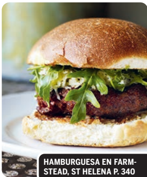
HAMBURGUESA EN FARMSTEAD, ST HELENA P. 340