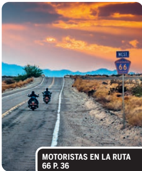
MOTORISTAS EN LA RUTA 66 P. 36