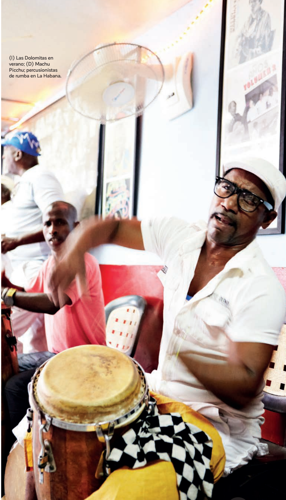
(I) Las Dolomitas en verano; (D) Machu Picchu; percusionistas de rumba en La Habana.