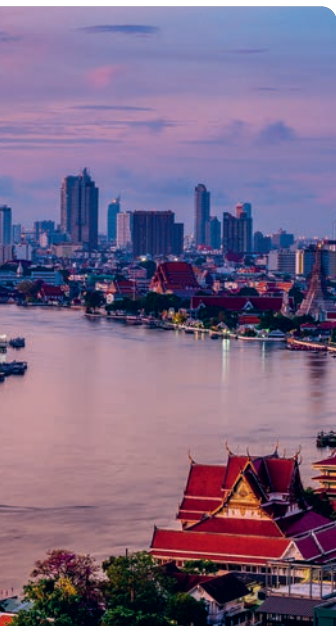
ARRIBA: SOUTHERNTRAVELER/SHUTTERSTOCK ©; ABAJO: RESTIMAGE/SHUTTERSTOCK ©