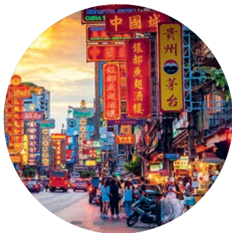
Arriba: Chinatown (p. 75). Abajo: 'skyline' de Bangkok.