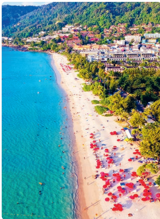
Hat Patong, Phuket (p. 502).