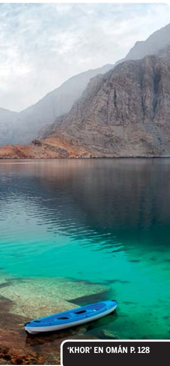
'KHOR' EN OMÁN P. 128