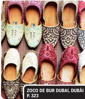
ZOCO DE BUR DUBAI, DUBAÍ P. 323