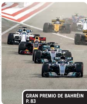
GRAN PREMIO DE BAHRÉIN P. 83