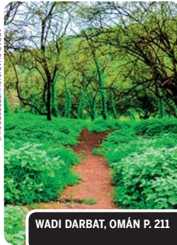
WADI DARBAT, OMÁN P. 211