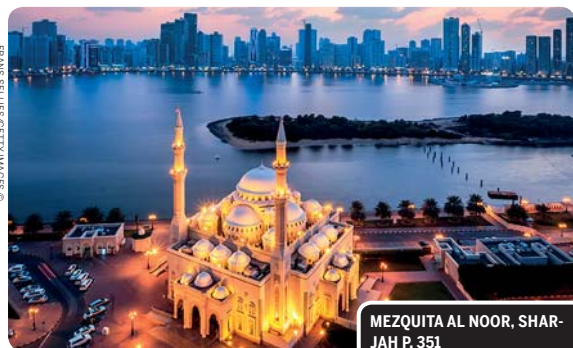
MEZQUITA AL NOOR, SHARJAH P. 351