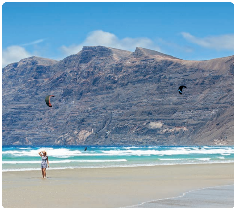
La Caleta de Famara (p. 114).