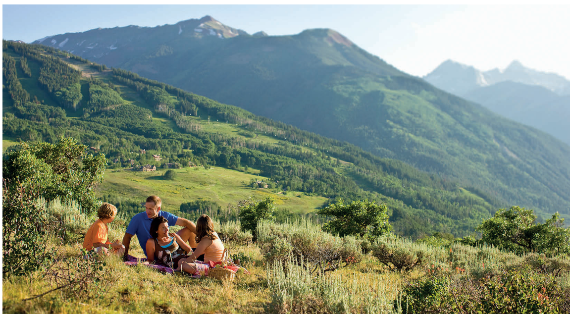
Un viaje brinda tiempo y espacio para reconectar como familia.

Antes de partir, hay que asegurarse de que todos los documentos estén actualizados. Muchos países emiten pasaportes biométricos y los niños suelen