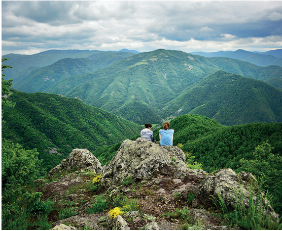
Las preciosas montañas verdes de Bulgaria.

Con sus paisajes intactos, este poco conocido rincón de Europa es el destino perfecto para unas vacaciones que combinen actividades al aire libre con el descubrimiento de un rico patrimonio cultural. Las ruinas romanas y tracias pueden inspirar a futuros arqueólogos, mientras los complejos de playa invitan a darse un chapuzón.