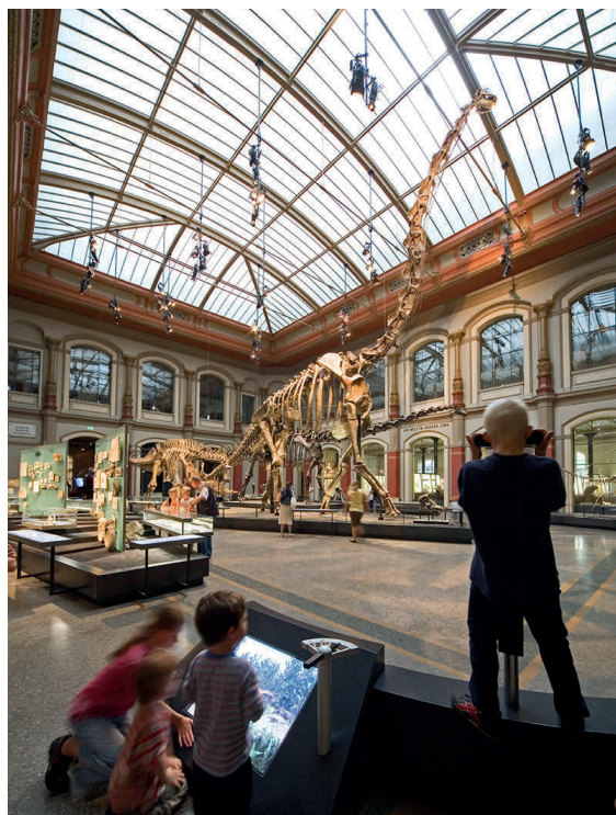
Los famosos dinosaurios del Museo de Historia Natural de Berlín.

Los bosques de Hansel y Gretel, los palacios románticos y las bellas y antiguas localidades con casas de vigas entramadas, deparan muchas sorpresas y tentaciones. Alemania ofrece mucho para ver, desde las grandes ciudades a los elevados Alpes.