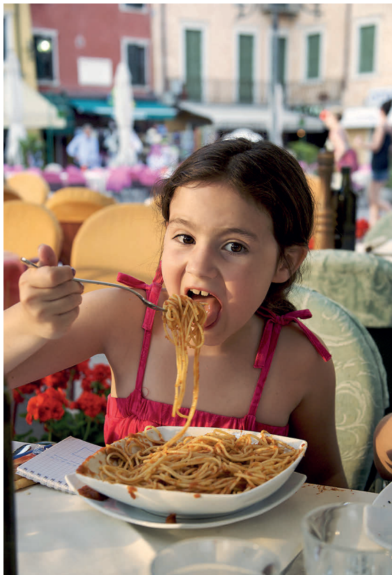
Comida sabrosa y saludable para descubrir nuevos sabores.

el país de destino. También pueden recomendar vacunas adicionales aparte de las obligatorias. Estas inyecciones pueden causar malestar a los niños, como, por ejemplo, la de la rabia. Si el niño presenta una reacción a la inmunización, normalmente unas 48 horas después de la inyección, se suele poder tratar con paracetamol (acetaminofén). Los niños pueden presentar alguna reacción más, a veces erupciones cutáneas incluso 10 días después de la inmunización. Cuanto antes se vacune a los niños, mejor.