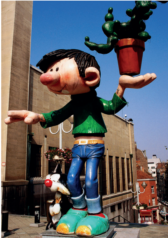
En Bélgica abundan los reclamos infantiles.

Chocolate, patatas fritas y cómics hacen de Bélgica un lugar atractivo para los jóvenes. Con sus agradables ciudades y sus rutas por los canales, hacia el mar y al interior del país, seguro que niños y adolescentes encontrarán algo que les guste.