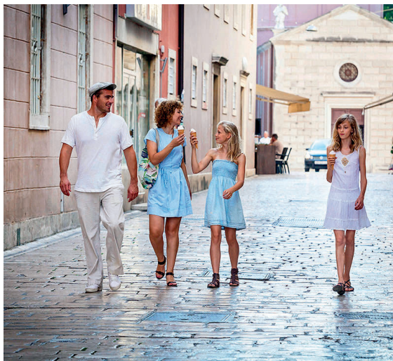
Disfrutando de un helado en la ciudad de Zadar.

Con su litoral accidentado, protegido por innumerables islas soleadas accesibles en barco, sus castillos medievales llenos de misterio y sus lugares de interés histórico, Croacia es el destino ideal para las familias que deseen combinar playa y un poco de cultura.