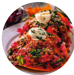
Comida guatemalteca (p. 30).