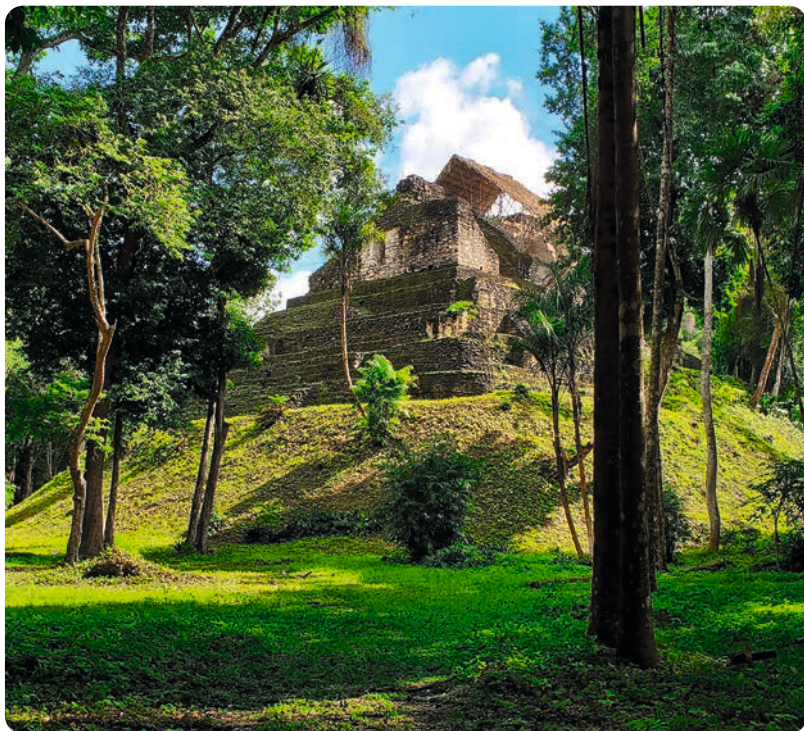
Naranjo (p. 131).