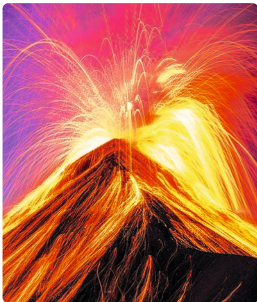
Volcán de Fuego (p. 176).