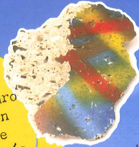
Trozo del Muro de Berlín.

Los trozos del Muro de Berlín no son pocos. ¡Se cree que puede haber más de 400 millones!