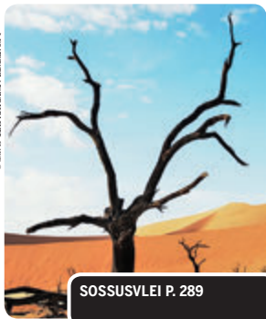
SOSSUSVLEI P. 289