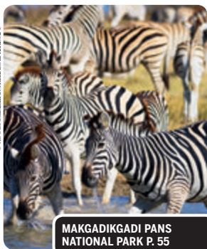
MAKGADIKGADI PANS NATIONAL PARK P. 55