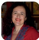
JULIÁN ROJAS ©