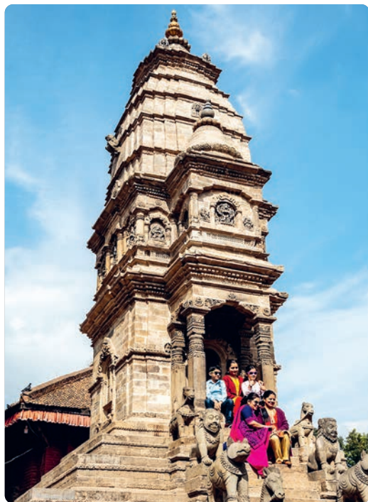
Templo de Siddhi Lakshmi (p. 143), Bhaktapur.