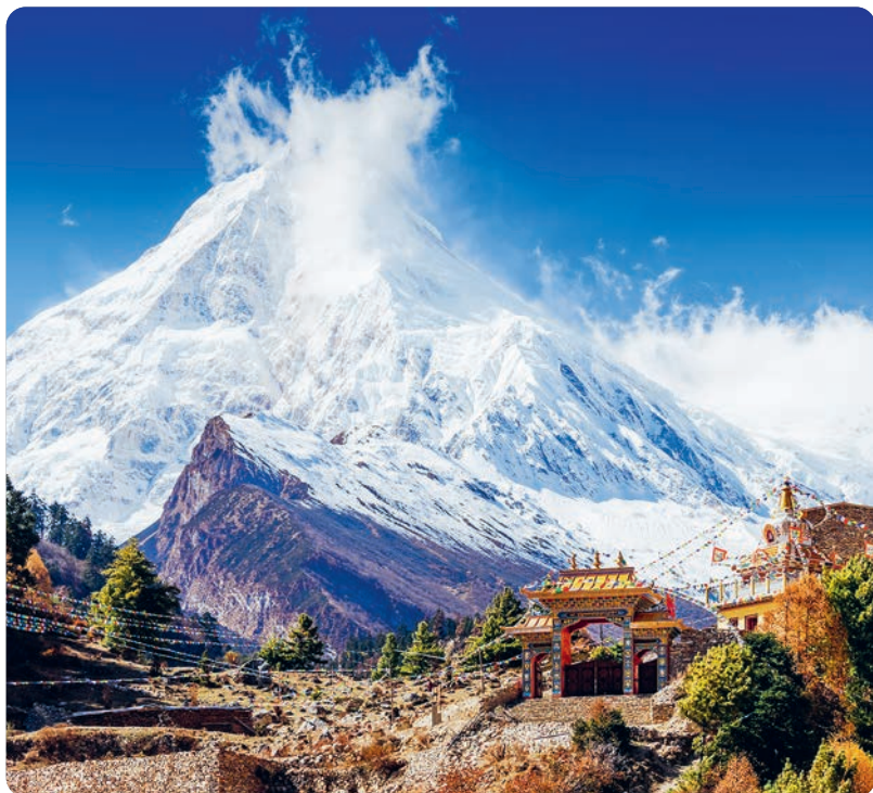
Manaslu, circuito del Manaslu (p. 288).