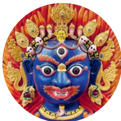
Máscara de Bhairab, Freak St (p. 84), Katmandú.