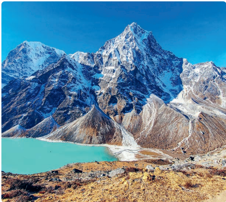
Cholatse Tso (p. 255).