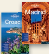
PAÍS, REGIÓN Y CIUDAD