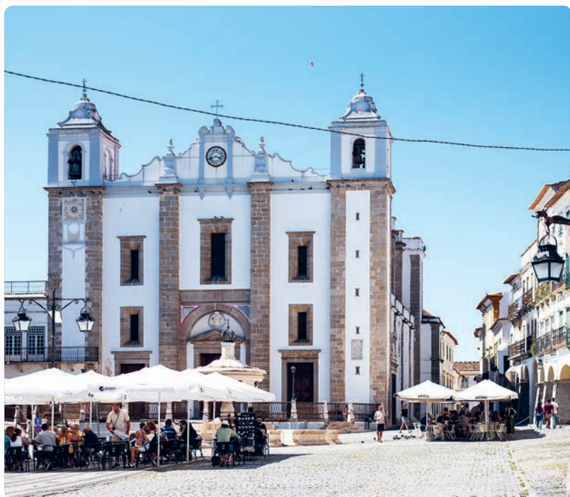
Praça do Giraldo (p. 219), Évora.