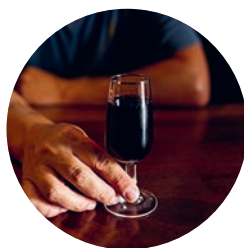
'Ginjinha', Bar Ibn Errik Rex (p. 269), Óbidos.