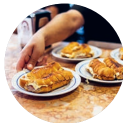
'Cachorrinho', Gazela (p. 357), Oporto.