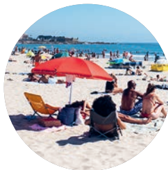
Praia de Matosinhos (p. 364).