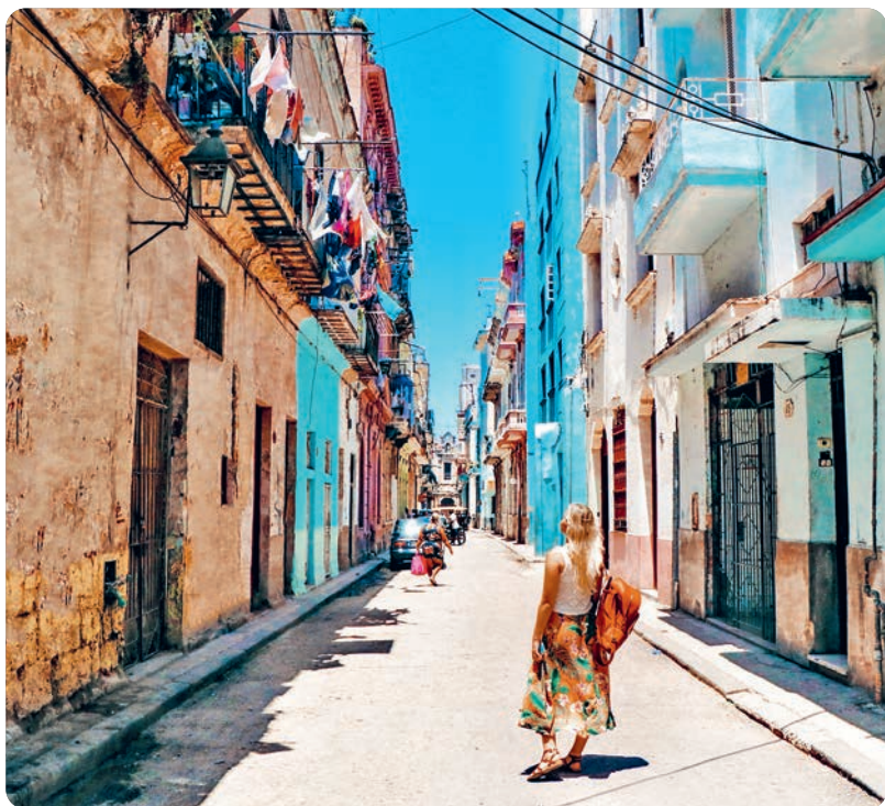
La Habana Vieja (p. 57).