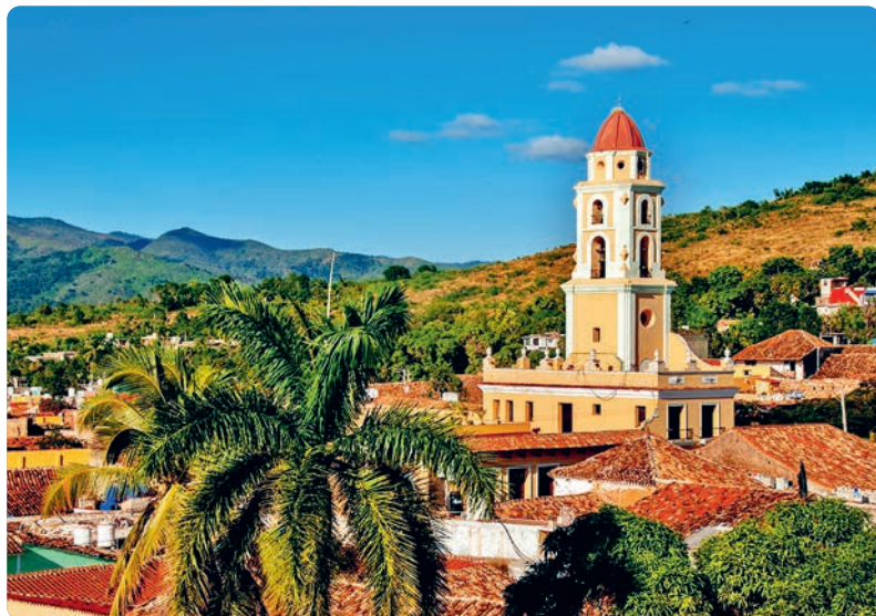
Trinidad (p. 194).