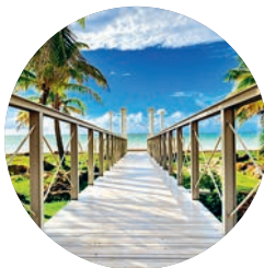
Varadero (p. 148).