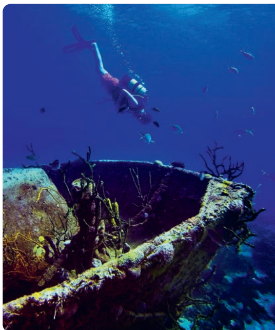
Submarinismo en la bahía de Cochinos (p. 164).