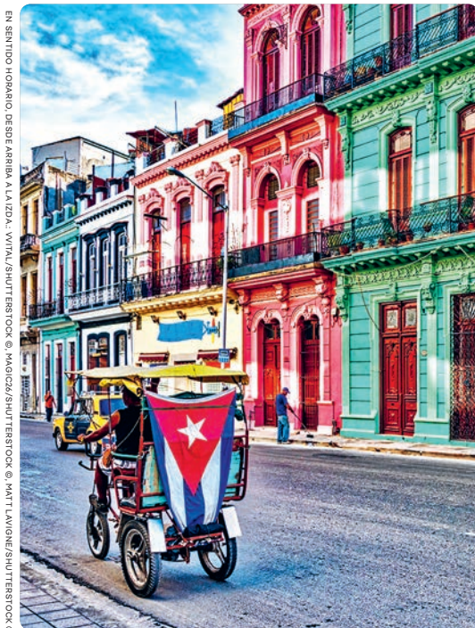
La Habana (p. 46).