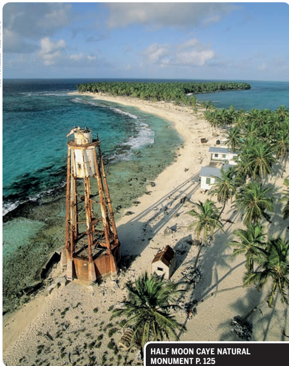
HALF MOON CAYE NATURAL MONUMENT P. 125