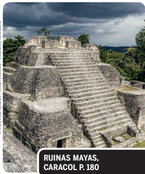
RUINAS MAYAS, CARACOL P. 180