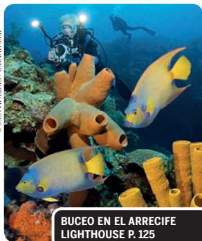
BUCEO EN EL ARRECIFE LIGHTHOUSE P. 125