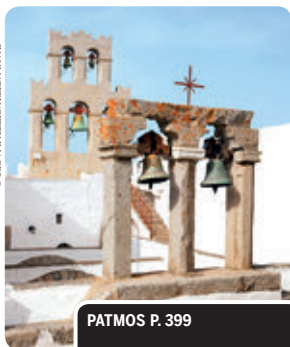
PATMOS P. 399