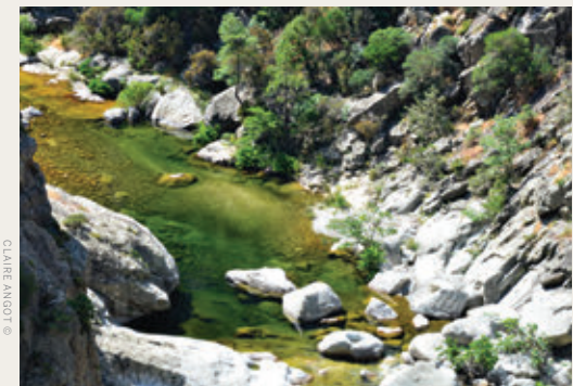
CLAIRE ANOÛT ©