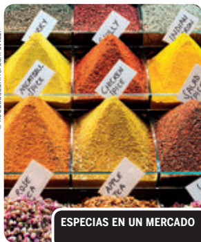
ESPECIAS EN UN MERCADO