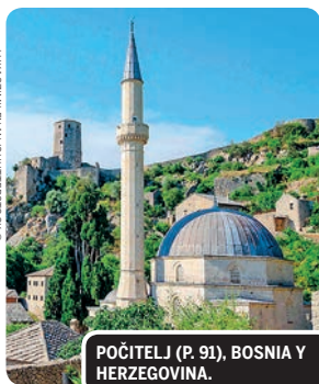
POČITELJ (P. 91), BOSNIA Y HERZEGOVINA.