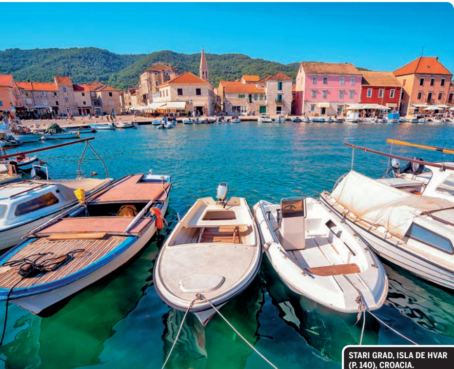
STARI GRAD, ISLA DE HVAR (P. 140), CROACIA.