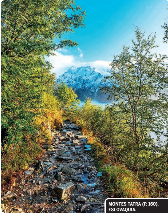
MONTES TATRA (P. 160), ESLOVAQUIA.