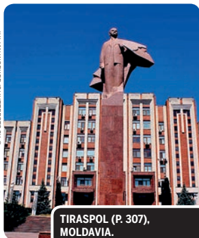
TIRASPOL (P. 307), MOLDAVIA.