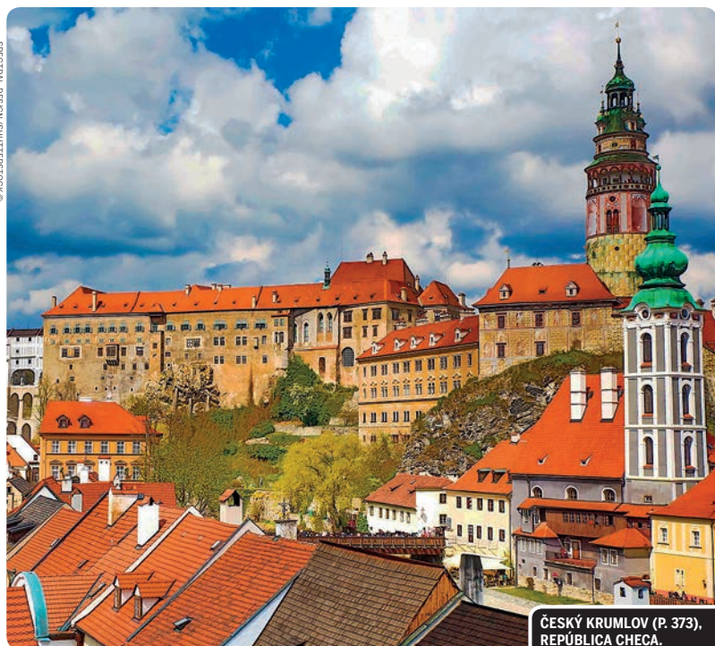
ČESKÝ KRUMLOV (P. 373), REPÚBLICA CHECA.