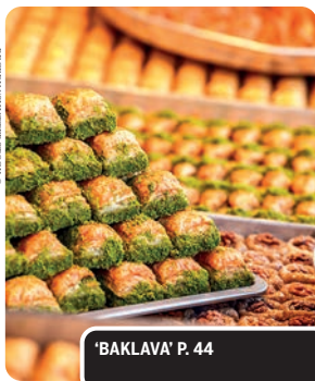
'BAKLAVA' P. 44