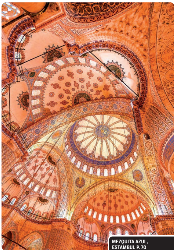
MEZQUITA AZUL, ESTAMBUL P. 70