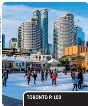
TORONTO P. 100