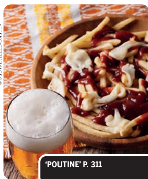
'POUTINE' P. 311