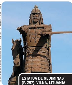
ESTATUA DE GEDIMINAS (P. 297), VILNA, LITUANIA