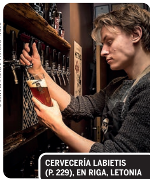
CERVECERÍA LABIETIS (P. 229), EN RIGA, LETONIA