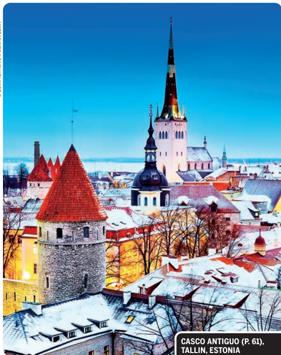
CASCO ANTIGUO (P. 61), TALLIN, ESTONIA