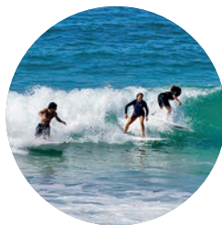
Florianópolis (p. 452).