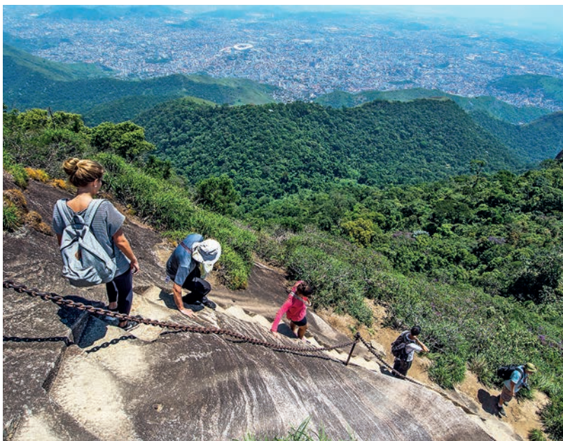
Parque Nacional da Tijuca (p. 61), Río de Janeiro.