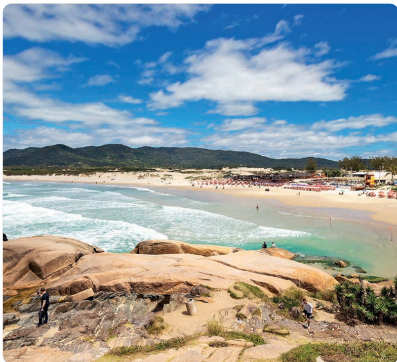
Praia da Joaquina (p. 454), Florianópolis.