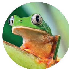
Rana arborícola, Amazonia (p. 144).