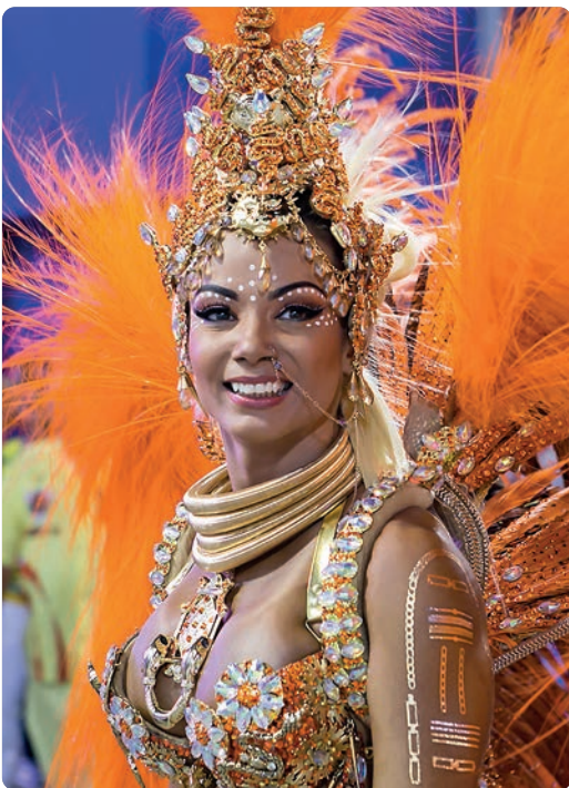
Bailarina en el Sambódromo, Río de Janeiro (p. 101).