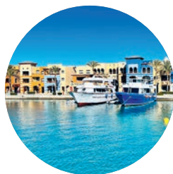
Port Ghalib, Marsa Alam (p. 323).