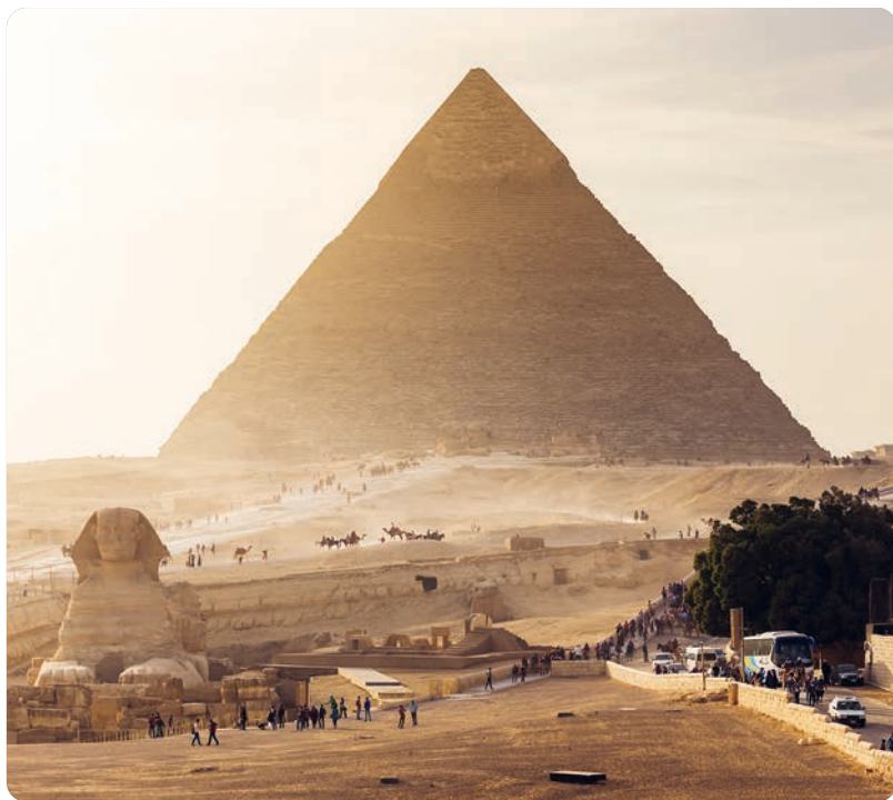
Guiza (p. 50), El Cairo.