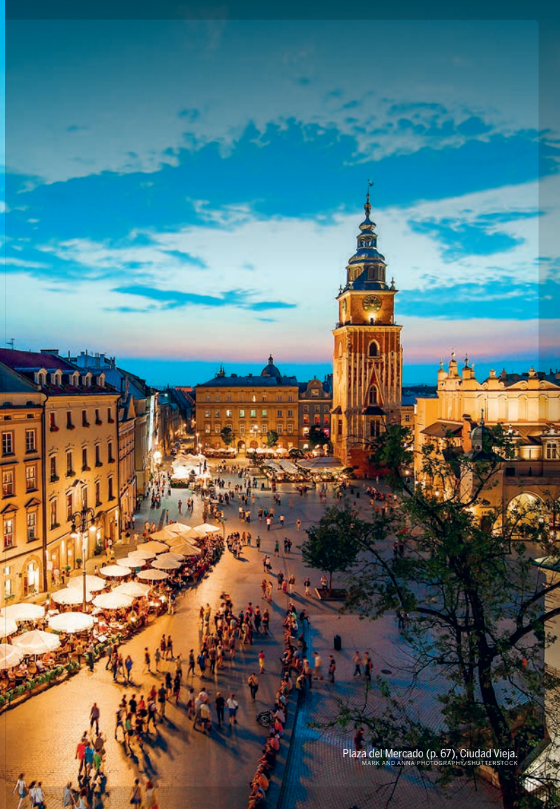
Plaza del Mercado (p. 67), Ciudad Vieja.