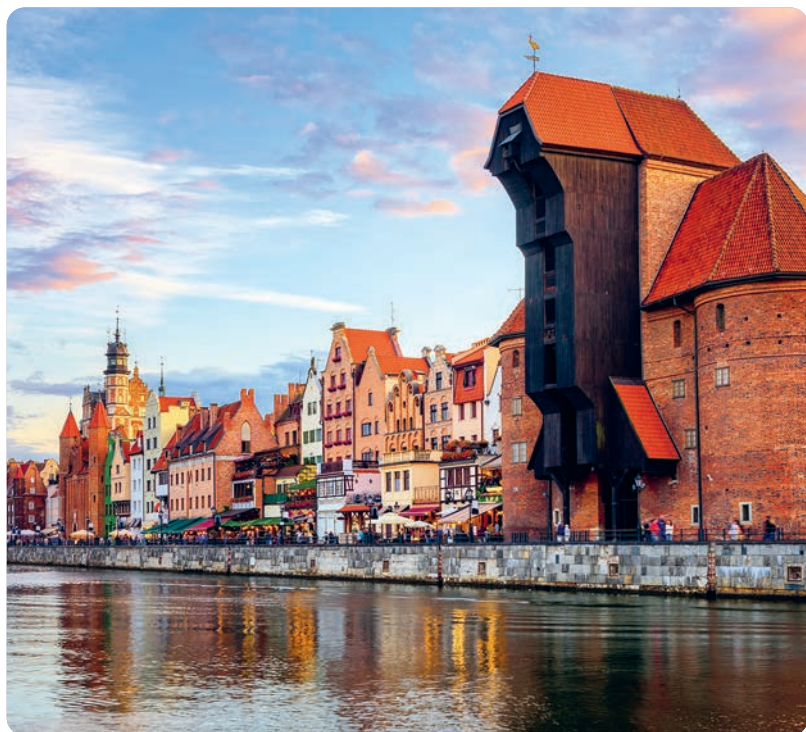
Grúa de Gdansk (p. 268) y el litoral de la ciudad.