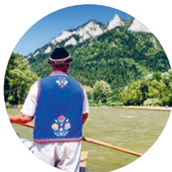
'Rafting', garganta del Dunajec (p. 198).