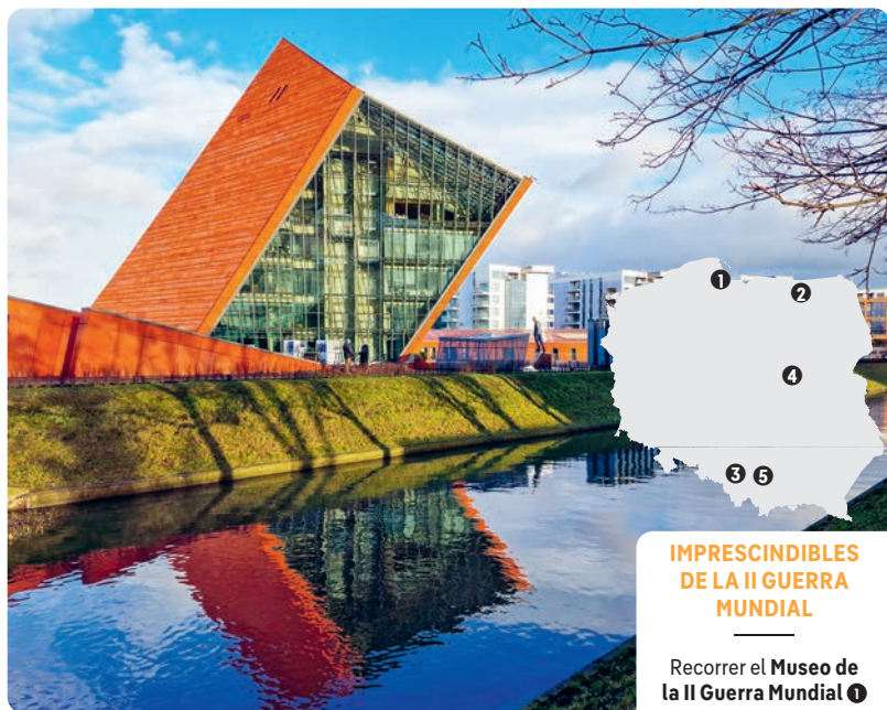
Museo de la II Guerra Mundial (p. 269).