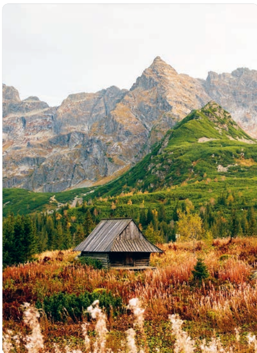
Montes Tatras, Zakopane (p. 172).